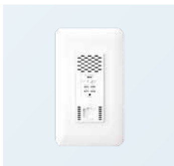
壁埋め込み型 アクセスポイント