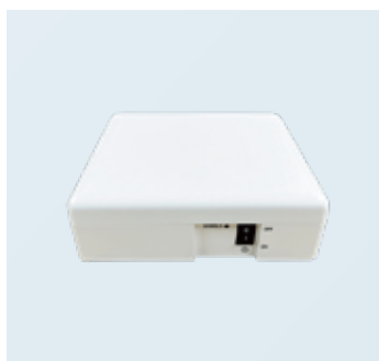
ルーター 兼 アクセスポイント